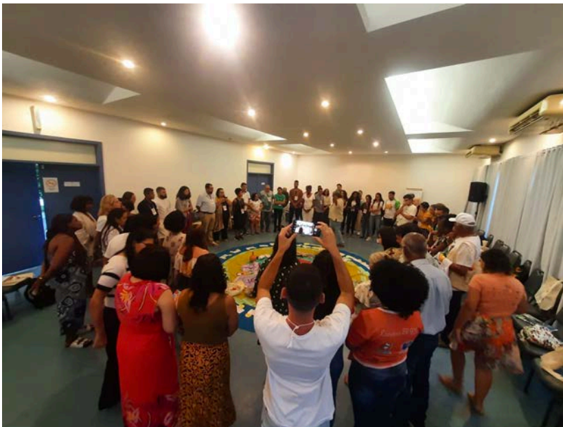
Encontro de donatários da IAF do Brasil em Olinda, Pernambuco.