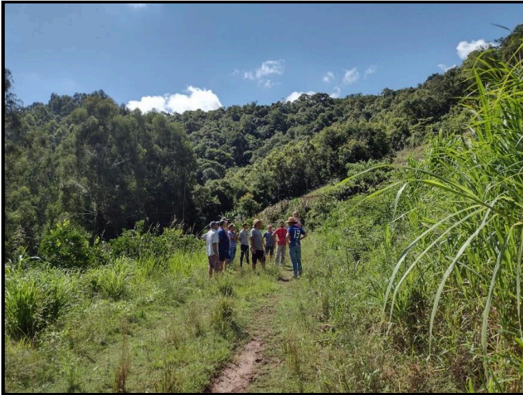
Visita do grupo de certificação em área de produção agroecológica.