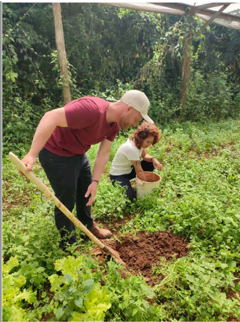
Visita técnica para a coleta de amostra de solo.