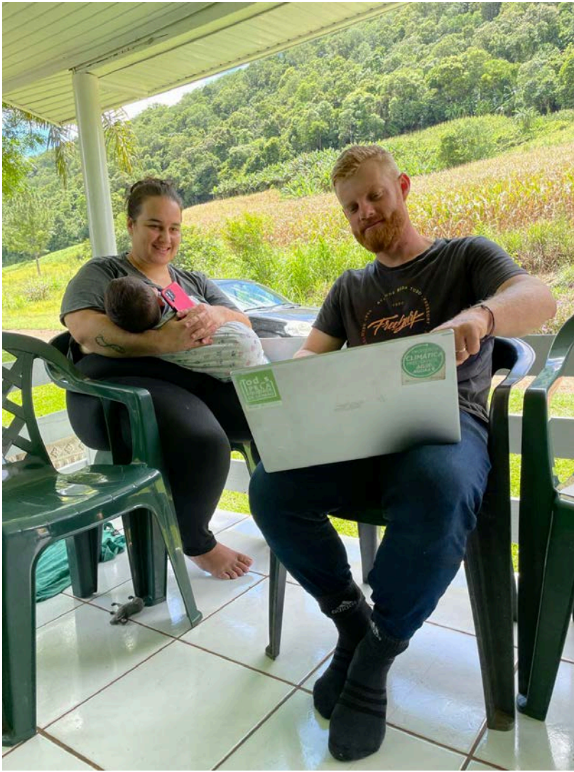
Visita a família de jovem bolsista a fim de apresentar as atualizações da ferramenta LiteFarm.