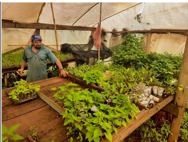
Visita técnica a unidade produtiva da Família Baldiga.