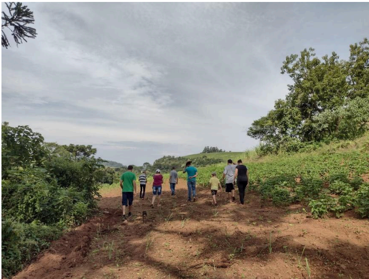
Visita do grupo de certificação em área de produção agroecológica.